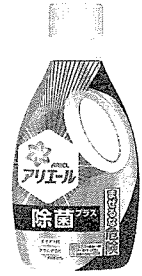
アリエール除菌プラスのボトルと詰め替え用パック。従来の洗剤よりも洗浄力に優れている。

P&Gは、衣料用洗剤「アリエール」ブランドから、液体アリエール史上初の除菌ができる「アリエール除菌プラス」(全5品、本体600g、詰替600g、詰替特大945g、詰替超ジャンボ1430g、詰替フルトジャンボ1680g、オンライン価格)を8月上旬に発売した。